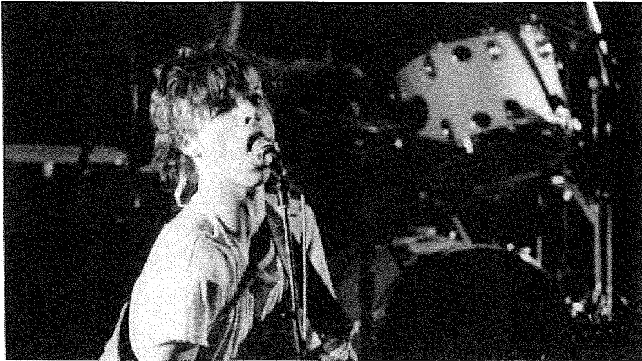
Ebbas ändalykt. Joakim Thåström, då sångare och gitarrist i Ebba Grön, släpper loss i Varberg 1981.