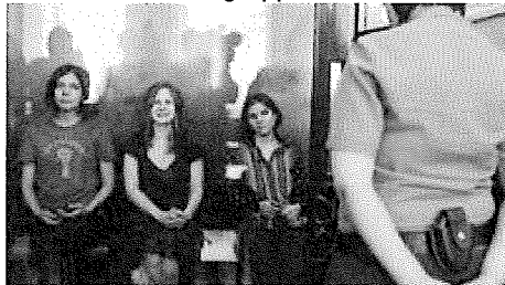
Pussy riot riskerar i dag att dömas till tre års fängelse.